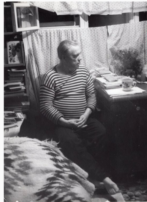
В.П. Астафьев в своем доме в Оймяконе. 1967