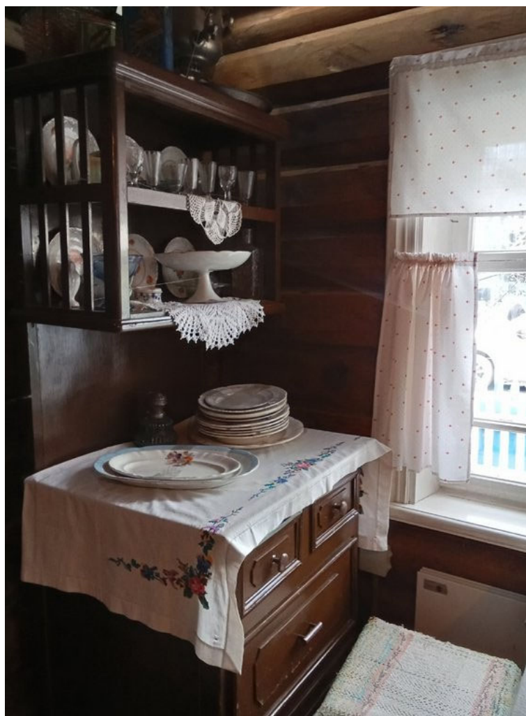
Рис. 3. Музей повести «Последний поклон»

творческий портрет прославленного человека (например, экспозиция Музея-квартиры А. Пушкина на Арбате, художник Е. Розенблюм)» 5 . Трудями архитекторов, историков, по воспоминаниям очевидцев, по книге В. Астафьева «Последний поклон» усадьба была восстановлена до мельчайших подробностей.