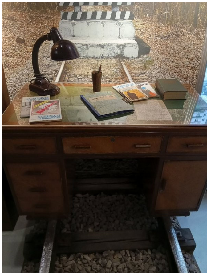
Рис. 4. Рабочий стол писателя. Национальный центр в с. Овсянка

центра заключается в музеефикации нематериального духовного наследия – текстов писателя. В залах воссоздана атмосфера произведений В. Астафьева.