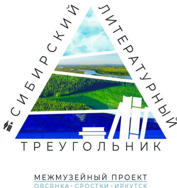
Рис. 7. Логотип межмузейного культурного проекта «Сибирский литературный треугольник» 6

«Сибирский литературный треугольник» – это уникальная возможность познакомиться с богатым литературным наследием Сибири, почувствовать ее дух и понять, почему она стала источником вдохновения для целого поколения писателей.