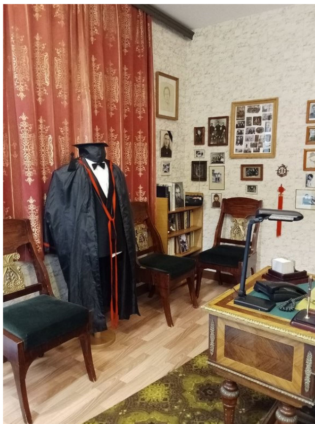
Рис. 5. Кабинет В.П. Астафьева. Национальный центр в с. Овсянка

В 2022 году Красноярский краевой краеведческий музей запустил межрегиональный проект «Сибирский литературный треугольник», призванный оживить литературное наследие Сибири и привлечь внимание к ее богатой культурной истории. Проект представляет собой уникальный литературно-музейный маршрут, пролегающий по трем сибирским регионам: Алтайскому краю, Красноярскому краю и Иркутской области. Каждый из этих регионов тесно связан с жизнью и творчеством выдающихся русских писателей, оставивших неизгладимый след в отечественной литературе. Так, Алтайский край – это родина Василия Шукшина, чье творчество пронизано духом сибирской деревни, ее традициями и непростой судьбой. Катунь, горная река, протекающая через Алтай, стала частью хронотопа его произведений, олицетворяя собой силу, красоту и свободу.