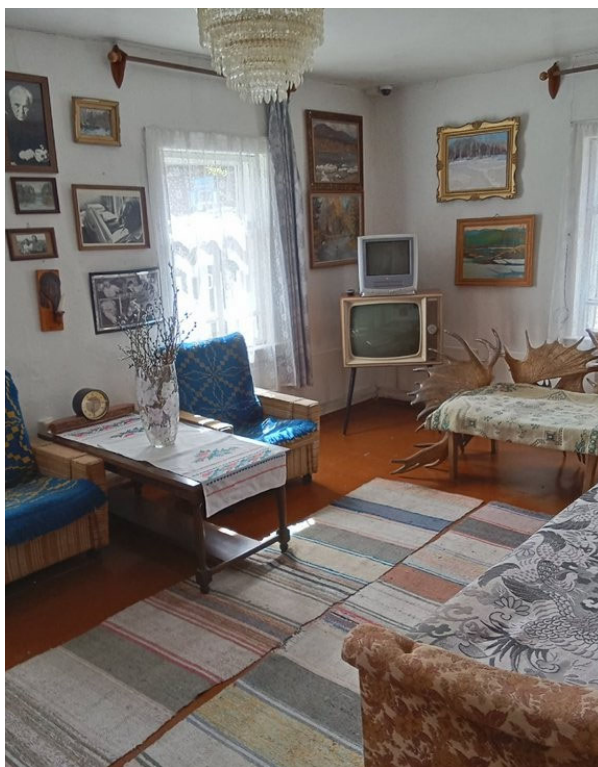
Рис. 2. Дом-музей В.П. Астафьева